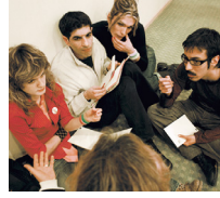
LGBTT Ağı Mart'ta Ankara'da toplanıyor. Toplantıda stratejik hedefler ve çalışma planı hazırlanacak.