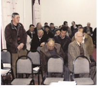
Yerel Yönetim-STK İşbirliği'nin üçüncü buluşması Seyrek'te. Toplantı Nisan ayında gerçekleşecek.