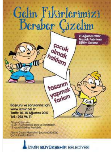
Sağda: İzmir Büyükşehir Belediyesi, 2017