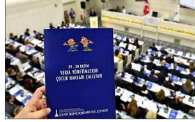
İzmir Büyükşehir Belediyesi, 2018

Bu doğrultuda çalışacak bir birim, kurumun çocuk çalışmalarının tek bir noktadan koordinasyonlu şekilde sürdürülmesini sağlamanın yanında çocukların ve çocuk alanında çalışan sivil toplum örgütlerinin kurum içinde bir muhatap bulmasını ve iş birliği geliştirebilmesini de kolaylaştıracaktır.