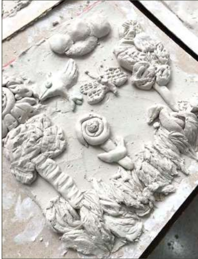
Üstte: İzmir Büyükşehir Belediyesi Çocuk Hakları Birimi ile Sığınmacılar ve Göçmenlerle Dayanışma Derneği'nin "Birarada Yaşam Atölyesi"

Sivil toplum örgütleri, odağına çocuk çalışmalarını alan bir birimin kurulması için belediyelere yönelik savunuculuk yürütebilir, belediyenin çocuk çalışmalarını, çocuk çalışmaları için ayrılan bütçeyi, hizmet kalitesini izleyebilir, çocukların kentte hakları ile görünür olması ve dezavantajlı çocukların kente katılımının sağlanması için proje geliştirebilirler.