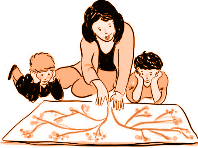
Çizim: Aslı Alpar

Eğer değerlendirmeleriniz sonrasında belediyelerle iş birliği yapmaya karar verdiyseniz aşağıda bu iş birliği için kullanabileceğiniz bazı dayanak ve yöntemleri görebilirsiniz. Her belediyenin ya da sivil toplum örgütünün hizmet alanı olarak belirlediği coğrafyanın ve nüfusun (hedef kitlenin) özellikleri, yönetsimsel çalışma koşulları, imkân ve etki alanları farklıdır. O bölgedeki çocukların durumunu ne kadar yakından bilirseniz belediyeye önereceğiniz çalışmanın çocuklar için fayda yaratacak şekilde hayata geçirilmesini sağlamış olursunuz.