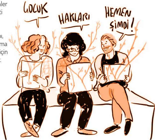
Çizim: Aslı Alpar

Devletler, karar vericiler, yetişkinler çocukların yaşam hakkını garanti etmek zorundadır. Çocukların sağlıklı gelişimini tamamlaması için gerekli eğitim, destek, altyapı, araçlar, koşullar çocukların yaşama ve gelişme hakkının korunması için yetişkinlerin sorumluluğundadır.