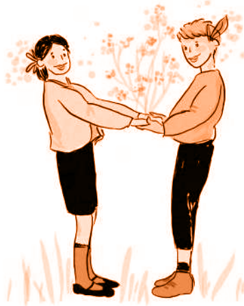
Çizim: Aslı Alpar

Her belediyenin halkla iletişimini kolaylaştıran destek hattı bulunmaktadır. Bazı belediyelerin 444'lü ya da 850'li, bazı belediyelerin ise 3 haneli kısa numaraları ya da bulunduğu ilin koduyla başlayan numaraları bulunmaktadır. Ayrıca bazı belediyeler, Beyaz Masa, Mavi Masa, Komşu Masa, Güvercin Masa, Turunc Masa gibi çağrı merkezleri ile iletişimleri sağlamaktadır. İletişim kurmak istediğiniz belediyenin bunun için kullandığı özel bir hat varsa buradan ilgili kişi ve müdürlükle irtibata geçilebilir. Ayrıca belediyelerde görüşülmek istenen müdürlük, makam ya da ilgili