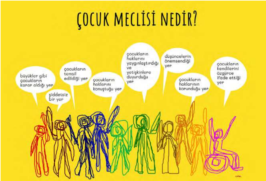
Tasarım ve Çizim: Ceren Suntekin, 2019

Kent Konseyleri, İçişleri Bakanlığı'na bağlı olarak belediyelerin desteği ile 5393 sayılı Belediye Kanunu gereğince, hemşehrilerin bulunduğu kentte kararlara etkin katılmalarını, birlikte yaşama kültürünün geliştirilmesi ve çok aktörlü yönetim anlayışını sağlamak için kurulmuş yapılardır. Dezavantajlı gruplar açısından baktığımızda, sivil toplum örgütleri ve kentlilerin aktif rol almaları ile çocuklar, gençler, kadınlar, engelliler gibi özel ihtiyaçlara sahip grupların karar alma mekanizmalarına katılmalarını kolaylaştıran ve kentin bu grupların varlığı ile düzenlenmesi için yerel karar alıcılara yönelik savunuculuk ve iş birliği faaliyetleri yürüten sivil yapılar olarak da ifade edilebilir. Kent konseyleri görev alanındaki konularla ilgili meclis ve çalışma grupları kurulmasını sağlar; işleyiş yürütme kuruluna bağlı olarak meclis ve çalışma grupları üstünden sürdürülür.