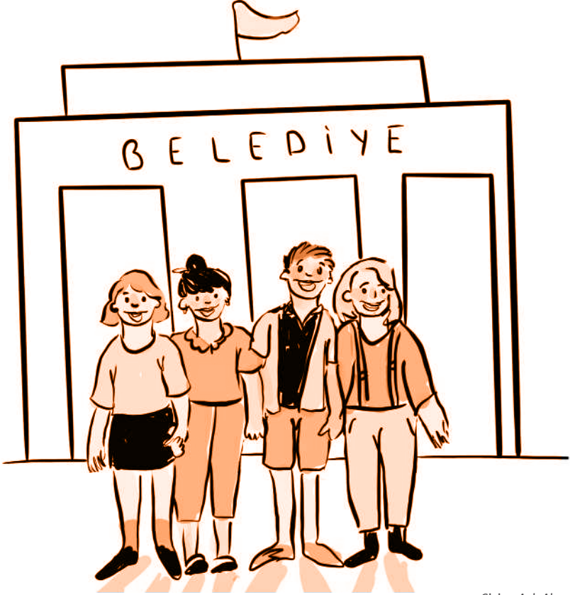
Çizim: Aslı Alpar

yönelik projelerinizde hibe programlarına yapacağınız başvurular için paydaş, iştirakçi konumunda olabilir; yerele değer katan çalışmalarınıza referans olarak kentlilerin örgütünüzde gönüllü olmasını teşvik edebilir.