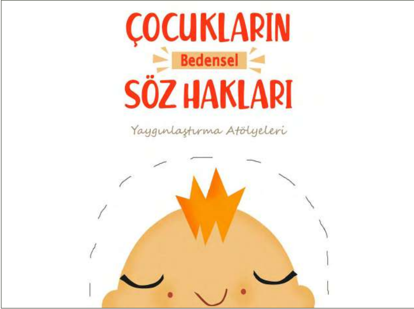
Tasarım ve Çizim: Ceren Suntekin, 2019

2018 yılında Cinsel Şiddetle Mücadele Derneği desteği ile Şişli Belediyesi tarafından yürütülen bir kampanya olarak başlatılan çalışma ile cinsel istismarla mücadelede toplumda doğru bilinen yanlışlara dikkat çekilerek başta karar vericiler olmak üzere yetişkinler bu konuda sorumluluk almaya çağırılmıştır. Kampanya kapsamında belediye personeliyle başlanarak tüm ilçede “Çocukların Bedensel Söz Hakkı” eğitimleri yapıldı ve koruyucu önleyici çalışmaların yaygınlaşması