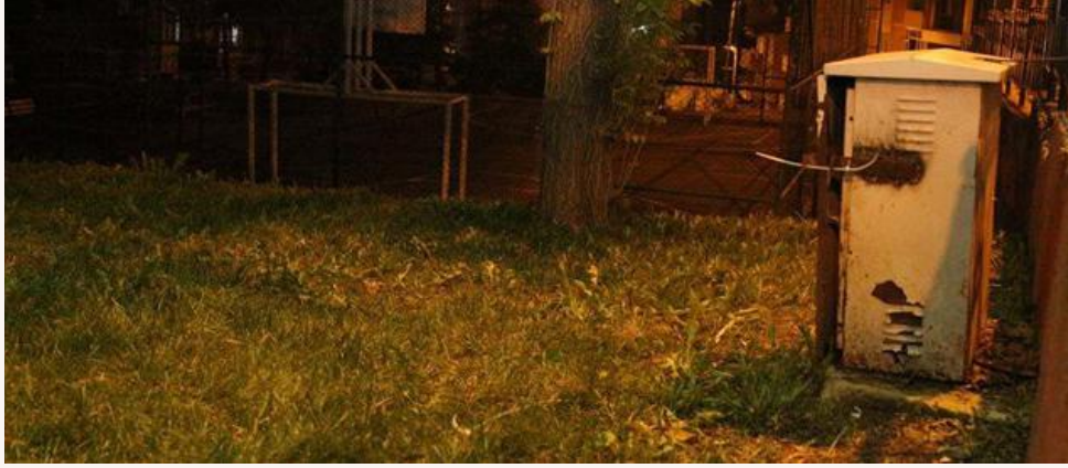
Şekil 4. İstanbul'da Parktaki Kaçak Elektrikten Dolayı Hayatını Kaybeden Çocuk Haberi.

Türkiye'de çocuk parklarında yaşanan bu olaylar, çocukların oyun alanlarında güvenlik ihmalinin söz konusu olduğunu göstermektedir. Oyun hakkının gerçekleştirilmesi için yapılan alanlarda güvenlik üst düzeyde olmalıdır. Dolayısıyla oyun alanları sınırlarının ve çevresinin, çocukların zarar görebileceği durumları öngörerek oluşturulması esastır. Güvenlik konusunda çocukların yüksek yararlarının gözetilmediği alanlarda yaşanan olaylar, tehlikeli durumun vurgusunu yapmakla beraber aynı zamanda çocuğun yaşam hakkı ve oyun hakkının ihlal edildiğini göstermektedir.