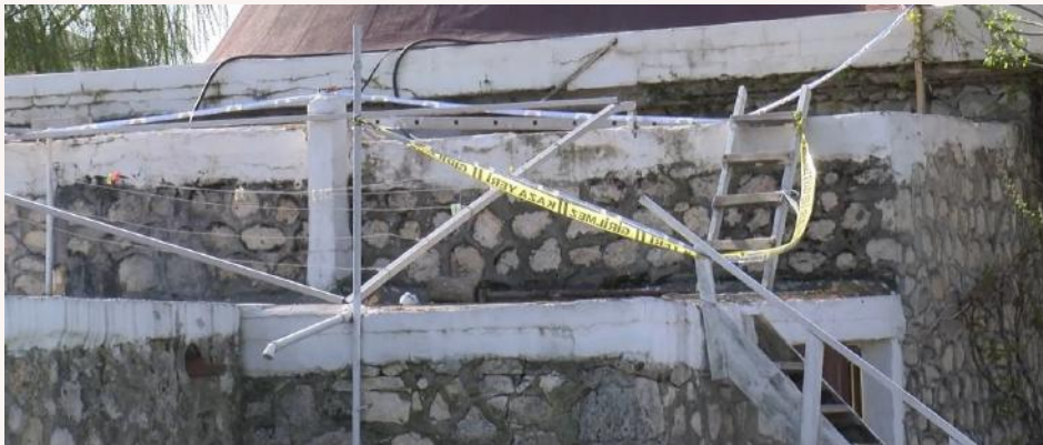
Şekil 1. Park sınırları içerisinde bulunan hamamın su deposuna düşerek hayatını kaybeden çocuk haberi.

• Daha önceden öngörülmemeyen, dikkatsiz bir şekilde tasarlanmış olan İstanbul Büyükkçekmece’de, 29.04.2021 tarihinde basında çıkan haberde, parkta oynayan bir çocuk park sınırları içerisinde bulunan hamamın su deposuna düşerek hayatını kaybetmiştir. Bu dikkatsizlik yerel yönetimlerin sorumluluğunda olup bir çocuğun hayatı güvenli ortam yaratılmadığından dolayı sona ermiştir.