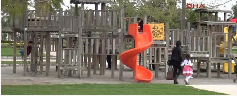
Şekil 2. Adana Parkta Düşen Çocuk Haberi.

• 18.03.2015 tarihinde Adana’da parkta oynayan 2,5 yaşındaki çocuk tırmanma zincirinden düşüp yaralanmıştır.