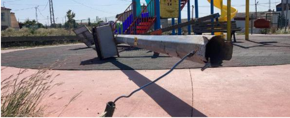
Şekil 3. İstanbul’da Parkta Üzerine Aydınlatma Direği Düşen Çocuk Haberi.

• Güvenlik ihmalinden kaynaklanan bir başka olay ise 15.09.2020 tarihinde basında yayınlanan, İstanbul Arnavutköy Hacımaşlı Mahallesi’nde meydana gelmiştir. 10 yaşındaki çocuk parkta oynarken aydınlatma direği çocuk üzerine devrilmiş ve çocuk hayatını kaybetmiştir.