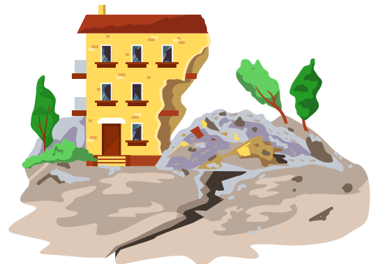
Tablo 6. Afetlerde Eşit, Güvenli ve Onurlu Erişim İhtiyacı