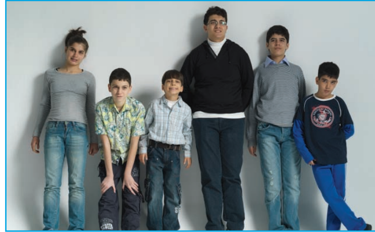
Kampanya fotoğraf çekimlerimizde gönüllü olan otizli çocuklarımıza ve ailelerine teşekkür ederiz...

Günümüzde engelliler için orta öğretim, "engelliler orta öğrenim yapmasın" noktasındadır. Otizli bireyler için orta öğretim de "zorunlu" olmalı, niteliğine uygun verilecek orta öğretim ile otizli bireylerin eve kapanarak aileleri ve sorunları ile baş başa kalmalarının önüne geçilmelidir.